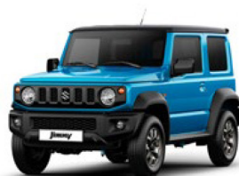
Brisk Blue Metallic & Bluish Black Pearl 3 (CZW)