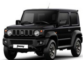
Bluish Black 3 (Z33)