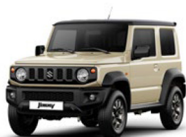
Chiffon Ivory Metallic & Bluish Black Pearl 3 (ZBW)