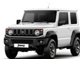
Superior White (Z6U)