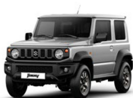
Silky Silver Metallic (Z2S)