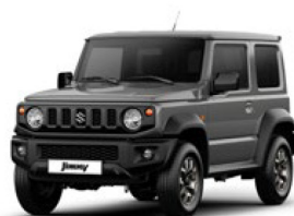
Medium Gray (ZVL)