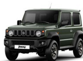
Jungle Green (Z2C)