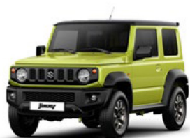
Kinetic Yellow Pearl 3 (DG5)