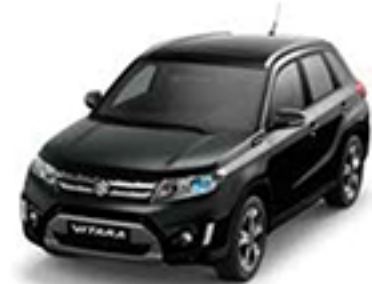
Cosmic Black Pearl Metallic