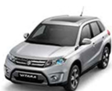
Silky Silver Metallic