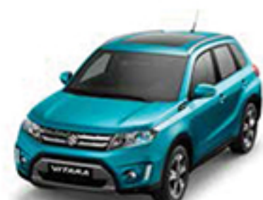
Atlantis Turquoise Pearl Metallic