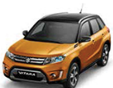
Horizon Orange Metallic & Cosmic Black Pearl Metallic