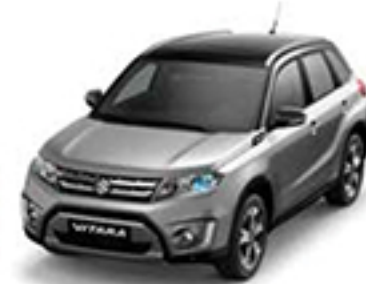
Galactic Grey Metallic & Cosmic Black Pearl Metallic