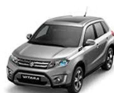
Galactic Grey Metallic