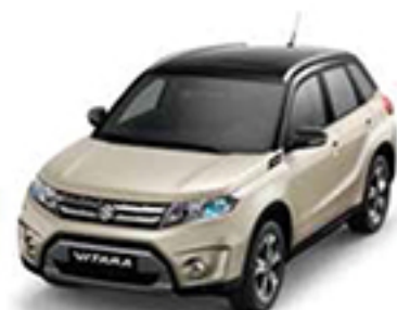
Savanna Ivory Metallic & Cosmic Black Metallic