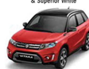
Bright Red 5 & Cosmic Black Pearl Metallic