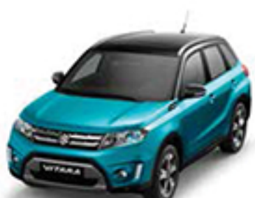
Atlantis Turquoise Metallic & Cosmic Black Pearl Metallic