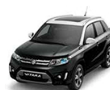
Cosmic Black Pearl Metallic & Superior White