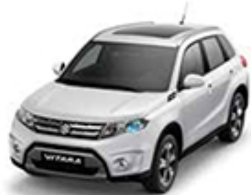
Cool White Pearl Metallic