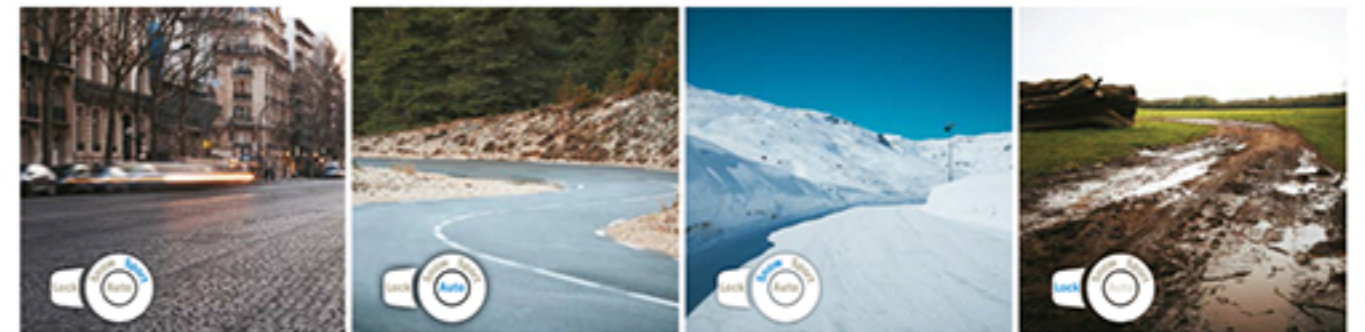
All Grip tehnologija sa svoja 4 mode vožnje